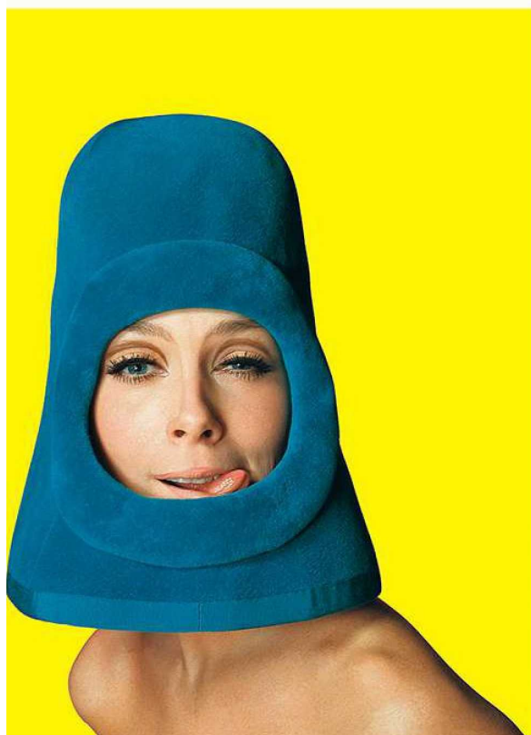
OLGA BY PIERRE CARDIN

PhotoBrussels Festival, Hangar, 18, place du Châtelain, à 1050 Bruxelles. www.photobrussefestival.com Jusqu'au 20 janvier prochain.